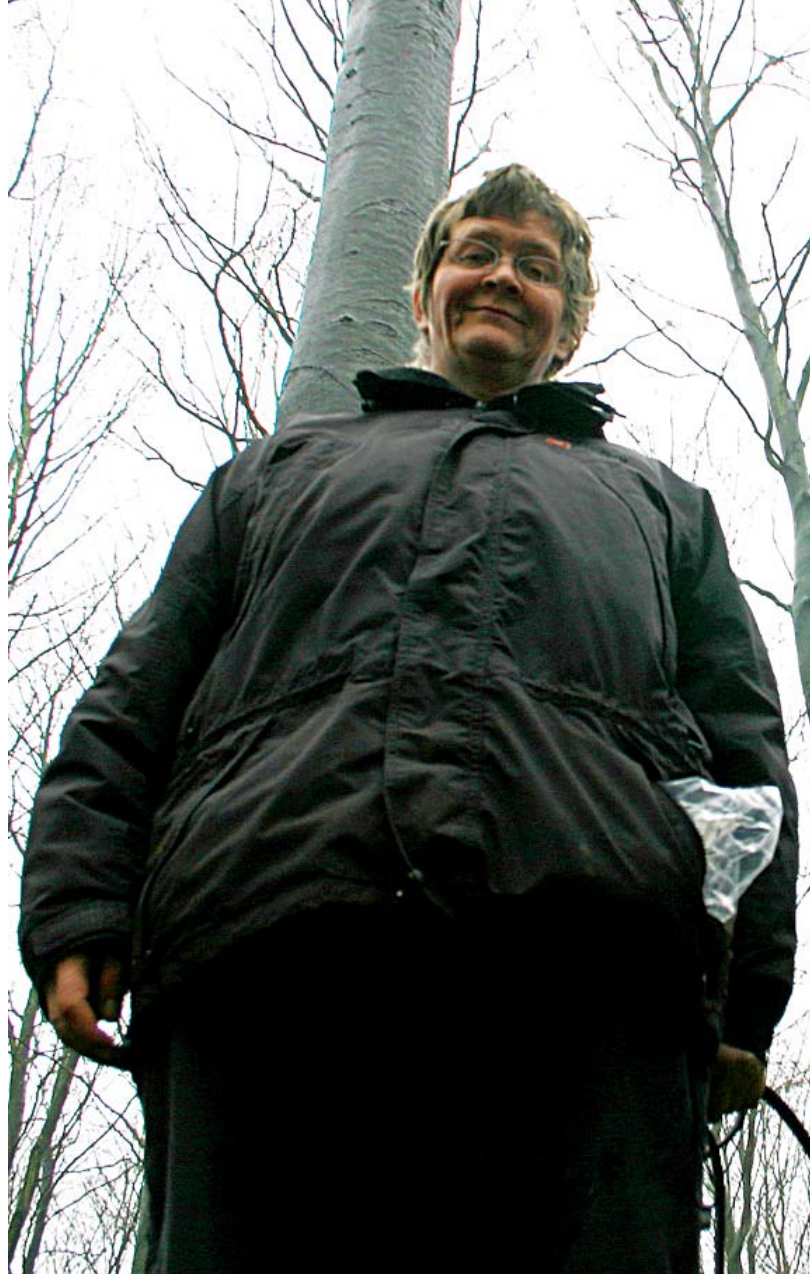
Husk lige, at hunden ser verden fra en anden højde

Evnen til at opfatte kontraster bliver større, når man ikke kan se farver. Hunde oplever kontraster mellem lys og mørke mere intenst end vi gør, fordi deres nattesyn er bedre end vores. Tænk på hvor tydeligt sort-hvide billeder er i forhold til farvebilleder og hvor mange detaljer man ser på sort-hvid billeder. Tilsyneladende kan dyr opfatte skygger, for eksempel på gulve, som niveauforskelle (og tro at de falder ned i et hul) og nogle hunde reagerer derfor voldsomt på lyse blanke gulve. Man ved fra mennesker der har mistet farvesynet totalt, at kontraster bliver me-