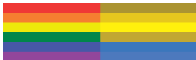
Regnbuen som mennesker opfatter den

Jeg har hørt flere fortælle, at de har lært deres hunde at skelne mellem tre bolde i forskellige farver. At det kan lade sig gøre kan skyldes to ting. Hundene kan glimrende se forskel på tre farver bolde, alene på nuanceforskelle. Forestil dig et sort-hvidt billede af de tre forskelligt farvede bolde. På et sådant billede vil man nemt kunne se forskel alene på de grå nuancer.