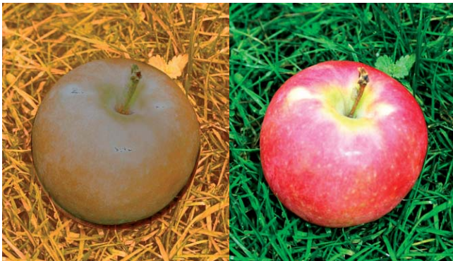
Rød grøn farveblind